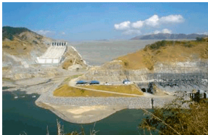
San Roque Filipini

Vsaka menjava olja, ki se ji izognemo ni samo prijazna do okolja, temveč tudi ekonomsko zanimiva.